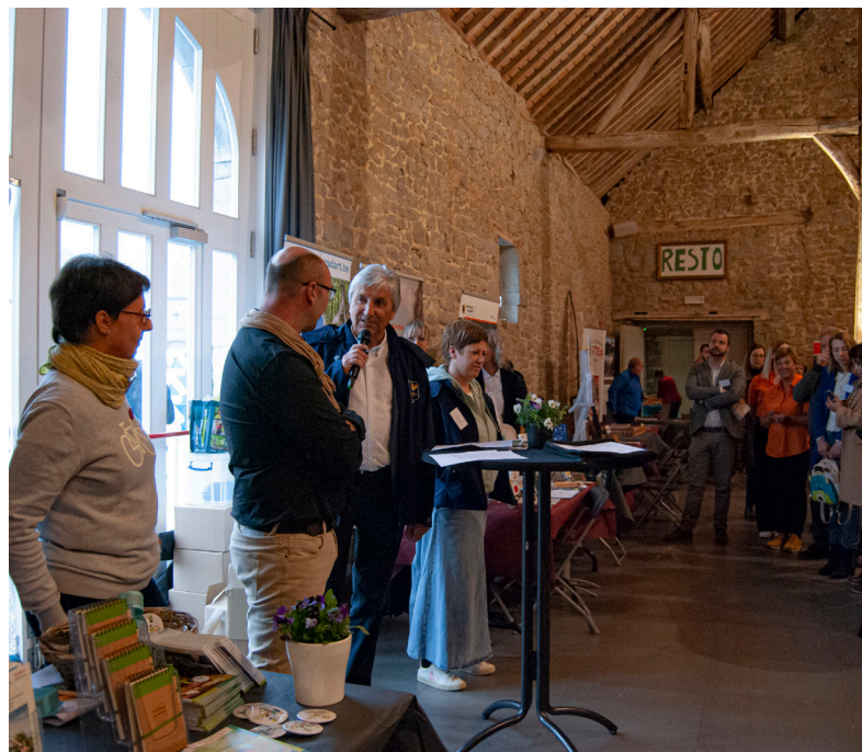
Carrefour du Tourisme

Lors de ce stage j'ai pu également découvrir la préparation d'un stand pour divers salons comme celui du Carrefour du Tourisme destiné aux opérateurs touristiques ainsi que le Salon Municipalia qui s'adresse aux mandataires et responsables des communes, provinces, associations, ... En collaboration avec Hungry Minds, l'agence de graphistes engagée par le CGT, nous avons réfléchi à la meilleure solution en terme de budget et d'occupation de l'espace pour notre stand. J'ai pu fournir les visuels et les données nécessaires pour que l'agence de graphistes réalise des panneaux autocollants électrostatiques reprenant l'ensemble des projets menés par le Commissariat Général au Tourisme. Cela m'a permis de travailler sur la notion de public cible pour adapter nos outils aux personnes que l'on souhaitait toucher lors des différents salons.