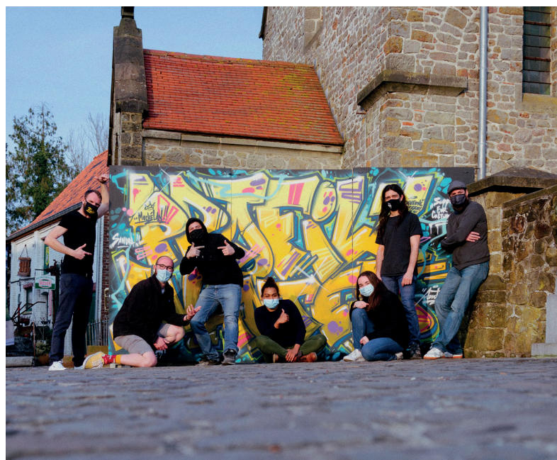
© 2021, GILLARD Eric - Projet Profil Wanted